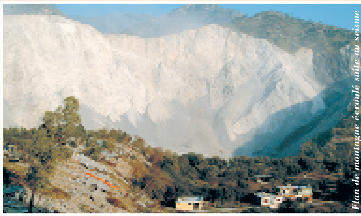
Plan de montagne éroulé suite au séisme

Le samedi 8 octobre 2005, à 8h50 (heure locale), un séisme d'une magnitude de 7,6 a frappé le Pakistan. Le Cachemire pakistanais et la région du nord-est ont été les plus touchés par cette catastrophe naturelle, la